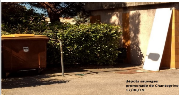
dépôts sauvages promenade de Chantegrive 17/06/19