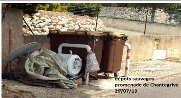
dépôts sauvages promenade de Chantegrive 29/07/19