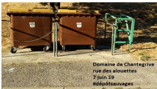
Domaine de Chantegrive rue des alouettes 7 juin 19 #dépôtssauvages

Trop souvent dans nos rues s'offre un spectacle de dépôts sauvages à côtés des conteneurs d'ordures ménagères. Outre que le fait que c'est interdit, cela nuit à l'image de notre quartier. Rien ne justifie ces comportements avec un ramassage quotidien et une déchetterie ouverte tous les jours.