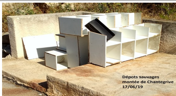
Dépôts sauvages montée de Chantegrive 17/06/19