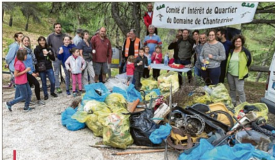
Une cinquantaine de riverains ont participé au nettoyage du quartier. Le butin de la collecte est malheureusement copieux.

Ces opérations conviviales de nettoyage permettent aussi de sensibiliser les usagers et riverains à un meilleur respect de l'espace public, aux gestes citoyens, cela autour d'un rendez-vous participatif. Ce samedi matin, une cinquantaine de bénévoles (sur les 370 habitations !), avec leurs enfants, protégés de gants et armés de sacs poubelles, ont sillonné le vallon. Avant l'été, la municipalité avait réalisé une importante opération de débroussaillage autour de la commune en prévention des incendies. Mais le fait de mettre à nu la colline, a mis en