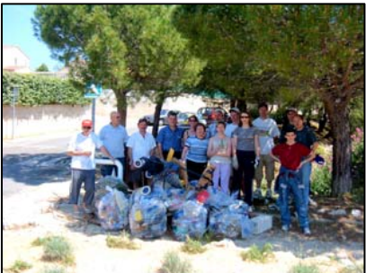
Les bénévoles après l'effort.

Remerciements : à la CUM qui a fourni une partie du matériel (gants et sac poubelles), et à la société LYONDELL CHIMIE France de Fos sur Mer qui a fourni les gants supplémentaires.