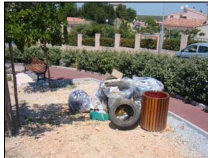
Cela fait partie du paysage naturel !